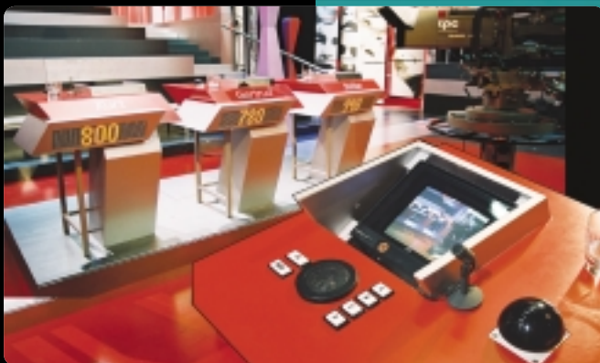
Kandidaten-Pulte im Studio. Von der Spielsoftware bis zur Dekoration wurde alles vom tpc gebaut.