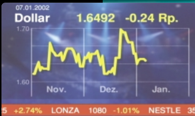
Der Ticker am unteren Bildrand bleibt immer im Vordergrund.